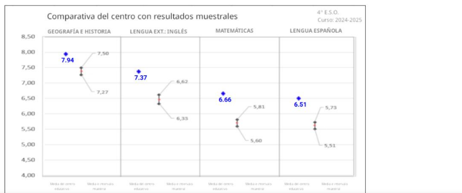
GRÁFICA DE PROMEDIOS POR MATERIAS