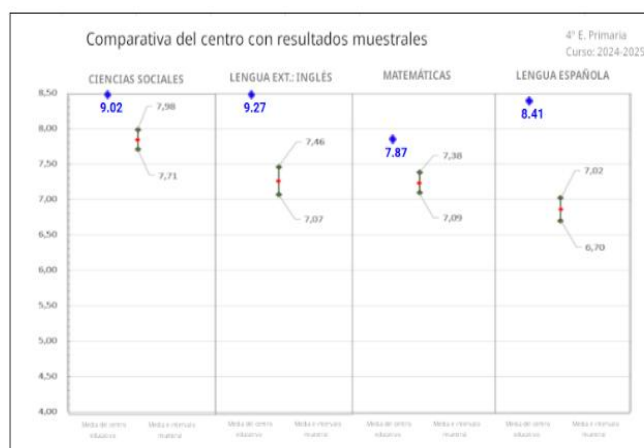
GRÁFICA DE PROMEDIOS POR ÁREAS