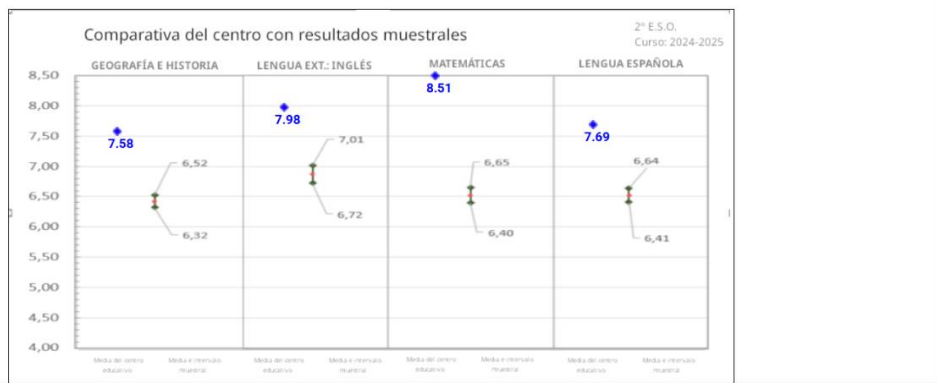
GRÁFICA DE PROMEDIOS POR MATERIAS